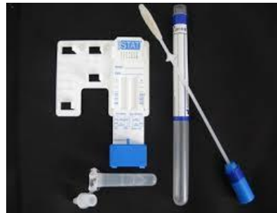
Zdj. Alkomat i test narkotykowy

Złamanie zasad niniejszej polityki ze strony gości terminalu, podwykonawców lub użytkowników będzie równoznaczne z naruszeniem zasad bezpieczeństwa BH i wydaleniem takiej osoby z terminalu.