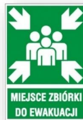
Zdj. Miejsce zbiórki do ewakuacji