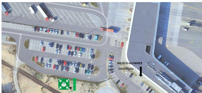
Zdj. Mapka z lokalizacją miejsca zbiórki do ewakuacji.