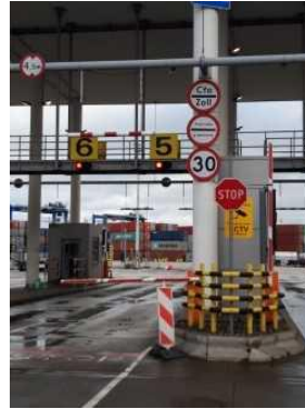
Zdj. Recepcja i brama wjazdowa.