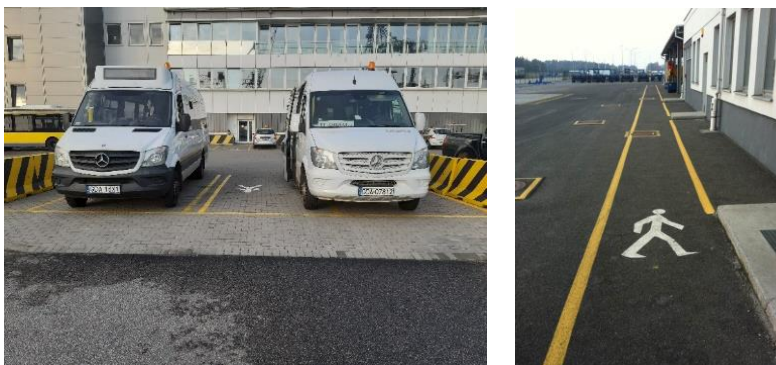
Zdj. Parking busów przed budynkiem administracyjnym i pieszy ciąg komunikacyjny.

W sytuacji, gdy pracownicy firmy zewnętrznej nie posiadają swojego środka transportu mogą skorzystać z busa BH po uprzednim uzgodnieniu z Kierownikiem Zmiany OPS. Parking busów znajduje na wewnętrznym parkingu przy budynku administracyjnym.