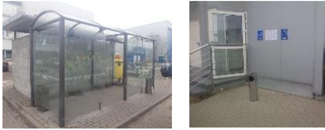
Zdj. Miejsca wyznaczone do palenia.