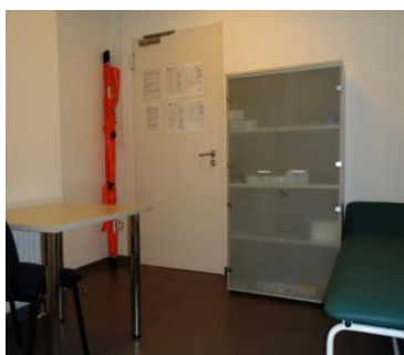
Zdj. Pomieszczenie punktu pierwszej pomocy w budynku administracyjnym.