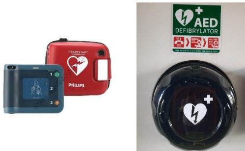
Zdj. Defibrylator AED