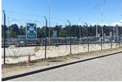
Zdj. Miejsce zbiórki do ewakuacji