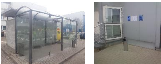
Zdj. Miejsca wyznaczone do palenia.