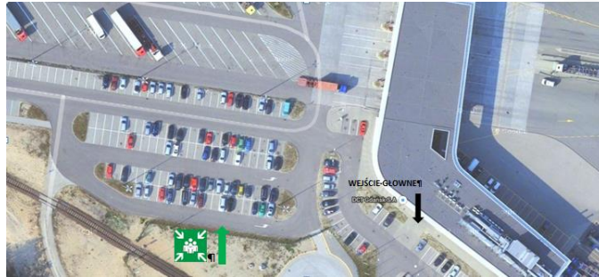
Zdj. Mapka z lokalizacją miejsca zbiórki do ewakuacji.